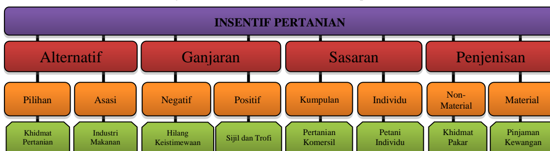
Rajah 1: Contoh Insentif Pertanian Bersepadu

Sumber asal: Lihat: Durrah, ‘Abdul BÉrÊ. (1982). Al-‘Ómil al-BasharÊ wa IntÉjyyah fÊ al-Mu’assasÊti al-‘Ómmah , Amman: DÊr al-FurqÊn. hal. 89.